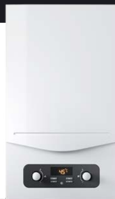
Standardowy kocioł 24 kW