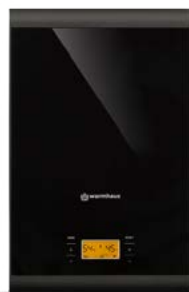
Warmhaus Minerwa 25

Niezwykła konstrukcja sprawia, że kotły Minerwa są znacznie mniejsze od kotłów konkurencji.