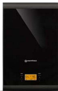
Warmhaus Minerwa 25

Niezwykła konstrukcja sprawia, że kotły Minerwa są znacznie mniejsze od kotłów konkurencji.